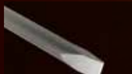
Flachmeißel Asphalt, Beton, Fels