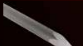
Spitzmeißel Beton, Fels